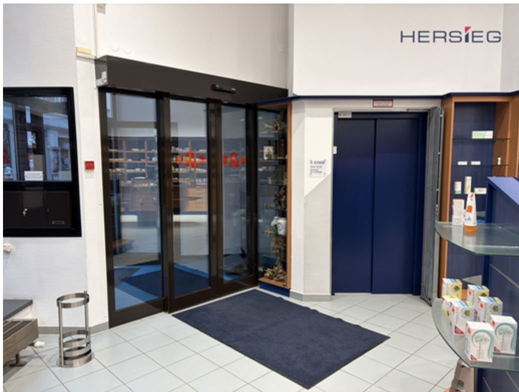
Eingang und Aufzug